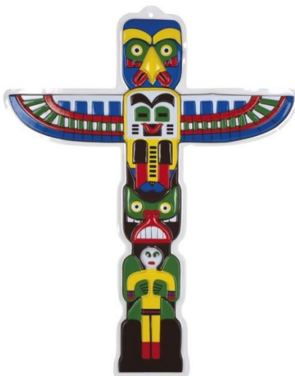
Indiánsky totem (Party – Store, 2020)

Určite ste už videli film, v ktorom vystupovali Indiáni. V takom filme ste mohli vidieť, že dôležitou súčasťou kultúry indiánskeho kmeňa bol totem. Ten symbolizoval ochranného ducha daného kmeňa. Totem bol vyrezávaný kôl, v hornej časti zakončený najčastejšie vyobrazením dravého vtáka. Všetky stretnutia indiánskeho kmeňa sa odohrávali okolo takého totemu. Vyobrazenie totemu je na nasledovnom obrázku.