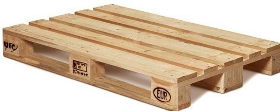
Euro paleta (Rexwood, 2020)

Euro paleta slúži na ukladanie rôzneho materiálu a jeho následnú prepravu. Má presne určené rozmery, aby mohla byť použitá pre tovary, ktoré sa prostredníctvom nej prepravujú. Spravidla je vyrobená z dreva, pričom úložná plocha je 0,96 \text{ m}^2 . Rozmery euro palety sú 1\,200 \times 80 \times 144 , pričom jej hmotnosť sa pohybuje v rozmedzí od 20 do 24 kg. Nosnosť euro palety je 1\,500 \text{ kg} = 1,5 \text{ t} . Jej konštrukcia je volená tak, aby sa dala presúvať nízkozdvížným alebo vysokozdvížným vozíkom alebo iným zdvíhacím zariadením. Výhodou euro paliet je ich opakovateľné použitie, pričom pri ich odbere s naloženým materiálom alebo tovarom sa za ňu platí záloha. Pri vrátení palety je zo zálohy odpočítaná určitá suma za jej opotrebovanie. Táto platba za opotrebovanie sa nazýva amortizácia . Existujú aj iné druhy paliet na prepravu materiálov, ktoré ale nemajú označenie „euro“. Ide o palety, ktoré sa spravidla nevracajú a sú jednorázové – na jedno použitie.